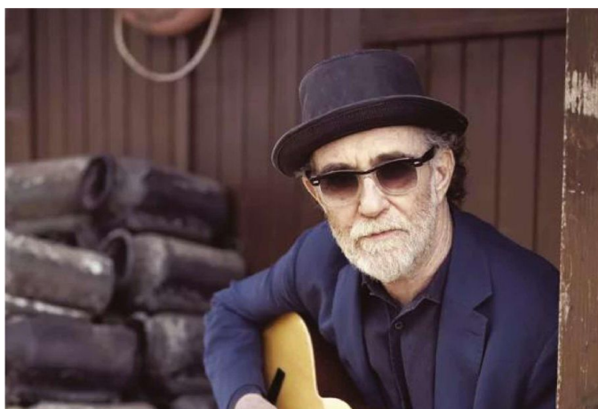
Francesco De Gregori. A destra, Skin e Alessandro Haber

FONDI MIBACT Musica, teatro e cinema nei luoghi simbolo dell'Abruzzo, per rilanciare i territori e dare un forte segnale turistico