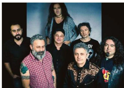
I Modena City Ramblers