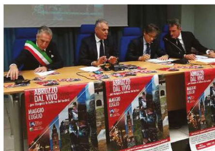
La conferenza stampa di ieri in Regione